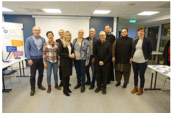
Foredragsholdere på chaplaincy-seminar, 31. oktober

Den 31. oktober arrangerte STL Bergen seminaret Chaplaincy i Bergen: tros- og livssynsmangfoldet på sykehus, sykehjem, i fengsel og i Forsvaret. Representanter fra disse institusjonene oppdaterte om hvordan åndelig og eksistensiell omsorg er organisert, og hvordan det tilrettelegges for livssynsmangfoldet blant pasienter, sykehjemsbeboere, innsatte i fengsel og ansatte i Forsvaret. Andre bidrag fokuserte på verktøy for kompetanseheving blant helsepersonell, fastleger og sykepleiestudenter. Seminaret utkomster vil bli utgangspunkt for arbeidet med likeverdige helsetjenester i 2019.