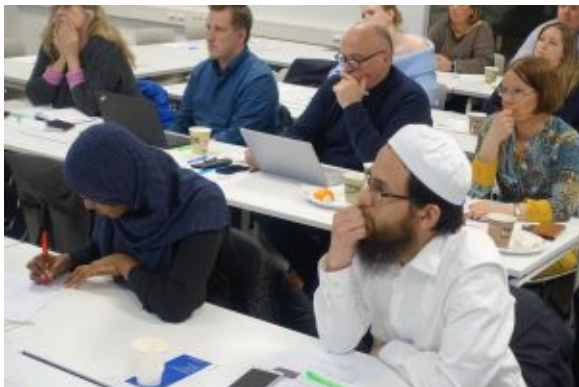
Kollokvium om holdninger til jøder og muslimer, 10. april