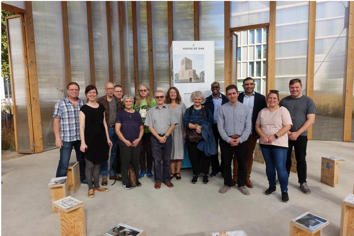
STL Bergen på studietur i Berlin, 11. – 14. oktober 2018