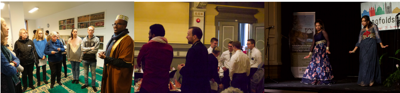
Åpent hus i Bergen moske, 28. september

Mangfoldsbyen bidrar til at flere av de allmenne medlemmene blir inkludert i tros- og livssynsdialogen, og til at STL Bergen blir bedre kjent i byen. Gjennom investeringer i markedsføring og nye tiltak opplevde vi et litt bedre oppmøte på de enkelte arrangementene sammenlignet med 2017, og dette forblir et viktig mål for Mangfoldsbyen 2019.